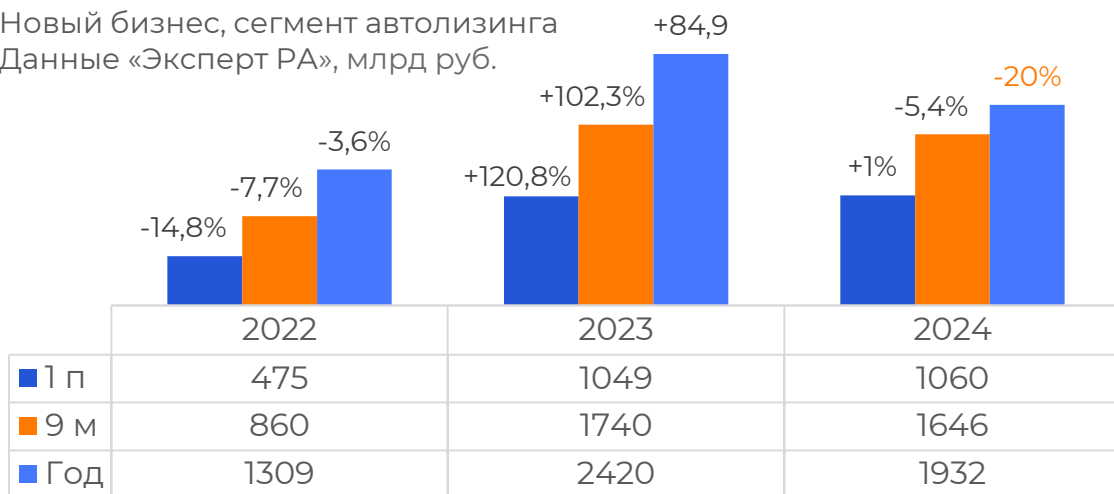
Новый бизнес, сегмент автолизинга Данные «Эксперт РА», млрд руб.